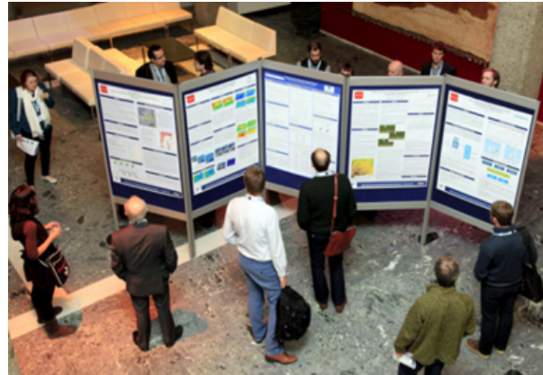
Imatges d'un congrés científic.