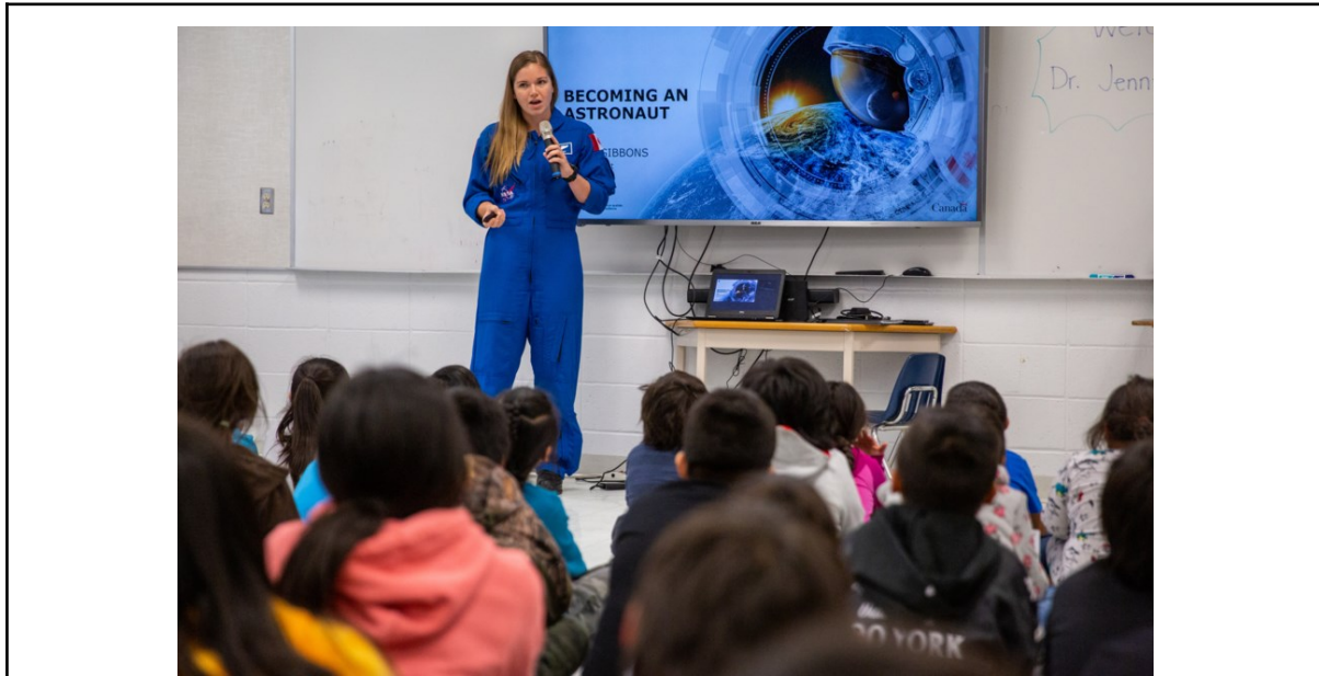
Conferència de l'astronauta canadenca Jenni Sidey-Gibbons.

Ara que ja tens el teu pòster a punt, només et faltaria assistir a un congrés científic i explicar el que has après. Un congrés és el lloc on es troben les investigadores per compartir els seus descobriments científics.